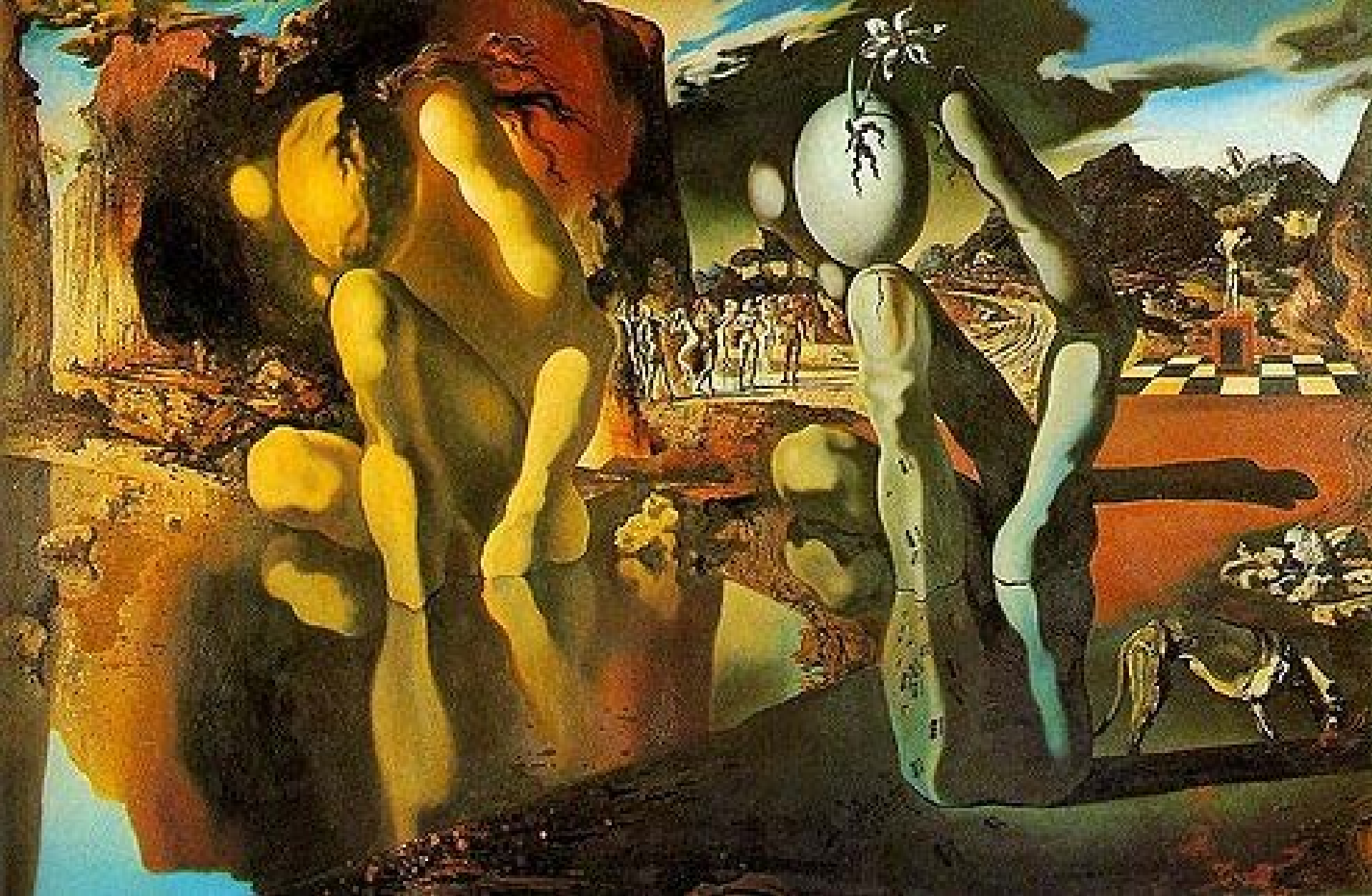
'Metamorphosis of Narcissus' av Salvador Dalí