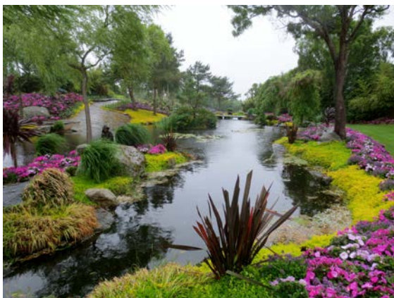
Ja, her kunne vi nytta,

Imponerte over Oljemuséet. Mest mål-lause over Flor og Fjære! For ein prakt! Og når så regnet stoppa og solglytta kom fram etter ein herleg lunsj, var det bare å gå omkring, suga til seg inntrykk og nytta alt det vakre.