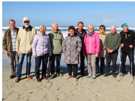
Ein flokk av kursdeltakarane brukte også siste dagen til utflukt: Vandretur på Orrestranda.

Også siste dagen blei det tid til tur; denne gongen til Orrestranda og vandretur med bølgeskvulp og vindsus som bakgrunnsmusikk.