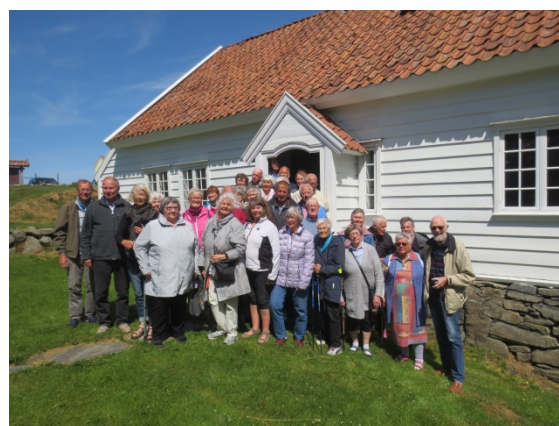
Gilt og lærerikt! Kursdeltakarane samla utanfor Garborgheimen.