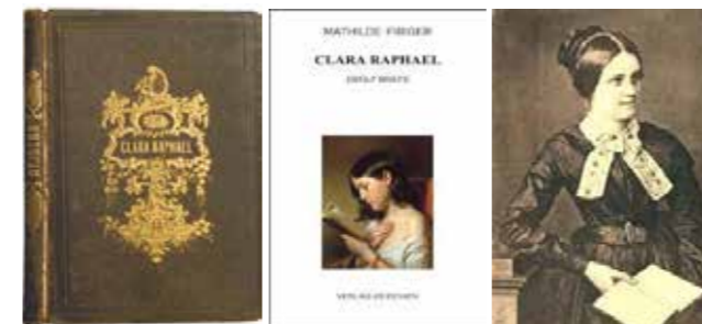
Clara Raphaels Tolv Breve og Mathilde Fibiger (1830-1872)

Det ble skandalesuksess i det litterære og politiske miljø i Danmark da den 20 år gamle Mathilde Lucie Fibiger (1830-1872) fikk utgitt sin første bok, brevroman Clara Raphael, Tolv Breve i 1850. Boka vakte enorm oppsikt. Det var Johan Ludvig Heiberg som publiserte boka, og skrev forordet. Han trakk seinere tilbake støtten. Striden som fulgte ble kalt «Clara Raphael-feiden». Etter å ha utgitt to romaner til, og blitt utstøtt av det bedre borgerskap, ga hun opp å skrive. Hun ble ansatt som telegrafist, Danmarks første kvinnelige tjenestemann. Fibiger døde bare 41 år gammel.