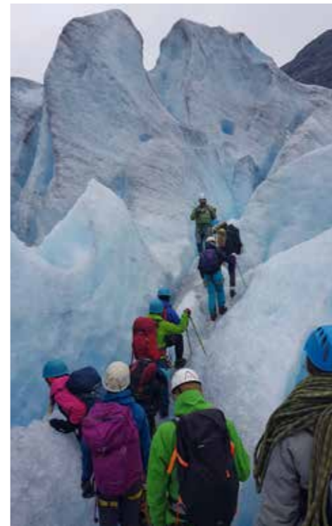
Bildet i midten: Hurdal Verk folkehøgskole

vi ofte noe som kommer litt ovenfra eller i hvert fall utenfra, noe informativt som man har bruk for. Akkurat nå drives det f.eks. mye folkeopplysning for å unngå smitte. Men den folkelige opplysningen er spørsmål som stilles av menneskene selv, og som ofte er av en mer eksistensiell karakter og omfatter hele tilværelsen. Det handler om den samtalen som folk har med seg selv, om seg selv og sitt liv. Og det er dette folkehøgskolene har som formål. Litt forenklet kan man si at linjefagene er uttrykk for den folkelige opplysningen, fordi de oppstår i tråd med de unges behov og interesser. Det tar sjelden lang tid fra noe blir populært til det oppstår som en ny linje i en eller annen norsk folkehøgskole. Typiske eksempler fra senere år er e-sport og hiphop.