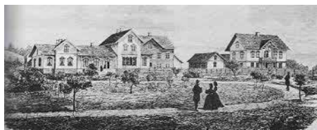
Norges første folkehøyskole, Sagatun. Hamar 1864.